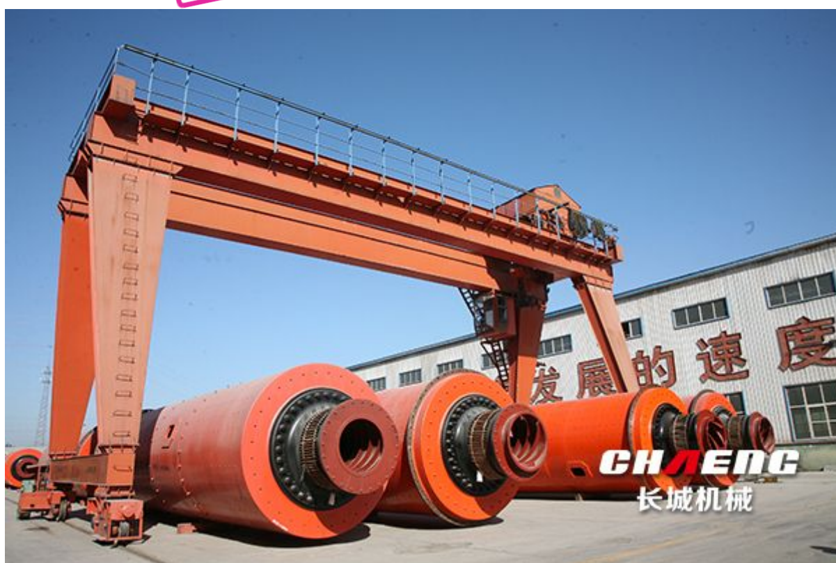
图：安阳水泥厂采用长城机械 \phi 4.2 \times 13\text{m} 中心传动水泥磨机