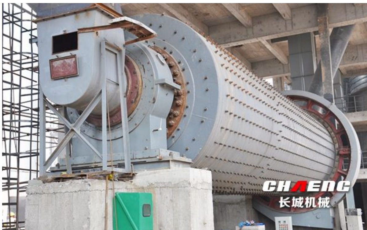
图：长城机械边缘传动水泥磨